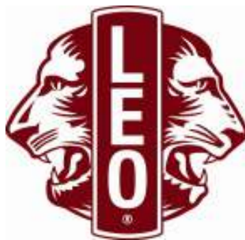
(Emblema Internacional de Clubes Leo)

Hay algo que los Leos poseen sobre los demás: oportunidades. De crecer, de formarse como líderes y personas responsables a través de los talleres, capacitaciones dictados en las conferencias y jornadas, a través de la investigación y estudio o de las obras y servicios brindados. Aprovechar las oportunidades es algo que distingue a los Leos, esto no los lleva a ser mejores personas pero sí les presenta nuevos caminos por donde transitar alejados de los falsos consumos circundantes hoy en día.